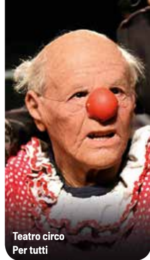
Teatro circo Per tutti

Uno spettacolo dinamico e divertente in cui gli attori fanno rivivere la storia del burattino più famoso al mondo attraverso una "scatola magica" da cui fuoriescono, in continua trasformazione, personaggi, oggetti, stoffe colorate e musiche. Un'allegoria della società moderna, dove emerge il contrasto tra razionalità e istinto, fame e benessere, generosità e ricerca del profitto personale. Ma anche la complessità del mondo infantile, così come quella di un mondo adulto che non sempre ascolta e guarda davvero all'essenza delle cose. Pinocchio non è solo una storia per bambini, perché Pinocchio è ognuno di noi.