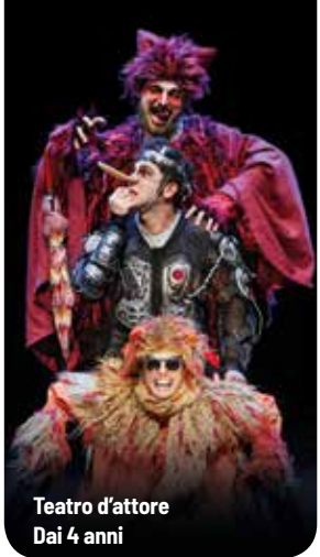
Teatro d'attore Dai 4 anni

Proponendo un ingegnoso miscuglio di musica dal vivo e teatro fisico, lo spettacolo è un sogno musicale che spazia dal jazz al blues, dal folk al rock, passando per Tchaikovsky, arrangiato e messo in condizioni di dialogare con gli altri generi che confluiscono in quell'andamento "swing" che dona il titolo all'opera. Un caleidoscopio di suoni, luci, rivolte e incantesimi che immerge i piccoli spettatori così come gli adulti in un mondo al confine tra il reale e l'onirico.