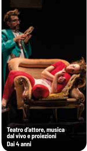
Teatro d'attore, musica dal vivo e proiezioni Dai 4 anni

A questa tenacia e agli adulti che la riconoscono e la curano lo spettacolo è dedicato.