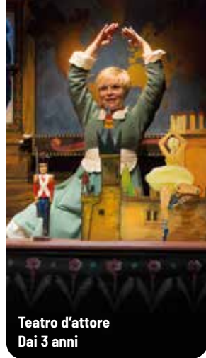
Teatro d'attore Dai 3 anni