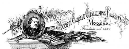
La Giovane Rossini